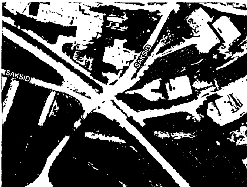
Priloga 3: slika z desne strani železniške proge na NPr 102.9