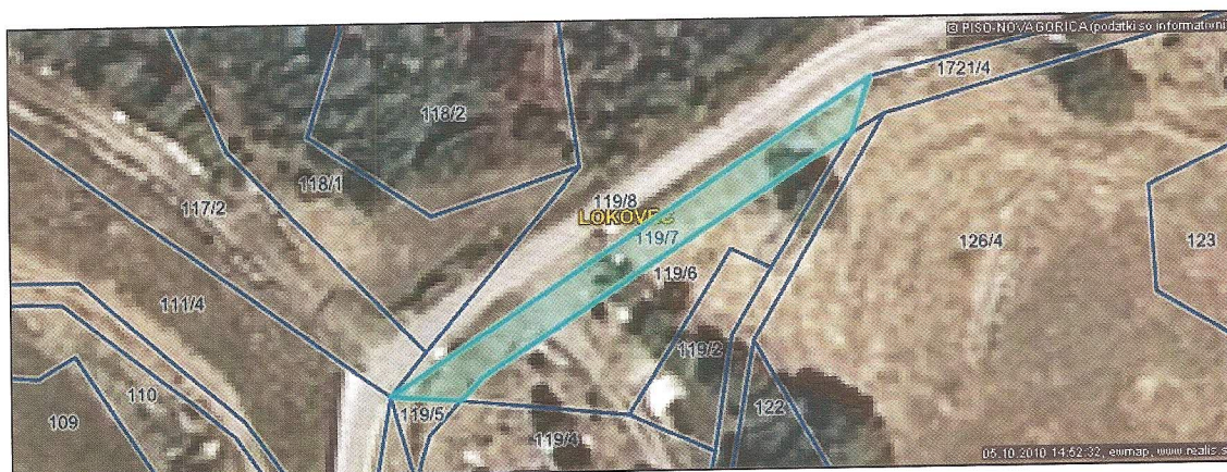
Parcela št. 119/7 k.o. Lokovec

V naravi predstavljata predmetni parceli št. 119/5 in 119/7 asfaltirano cesto skozi zaselek.