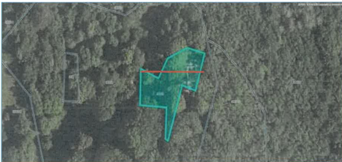
Slika 2.1: Lokacija parcele

Lokacija parcele je prikazana na sliki 2.1