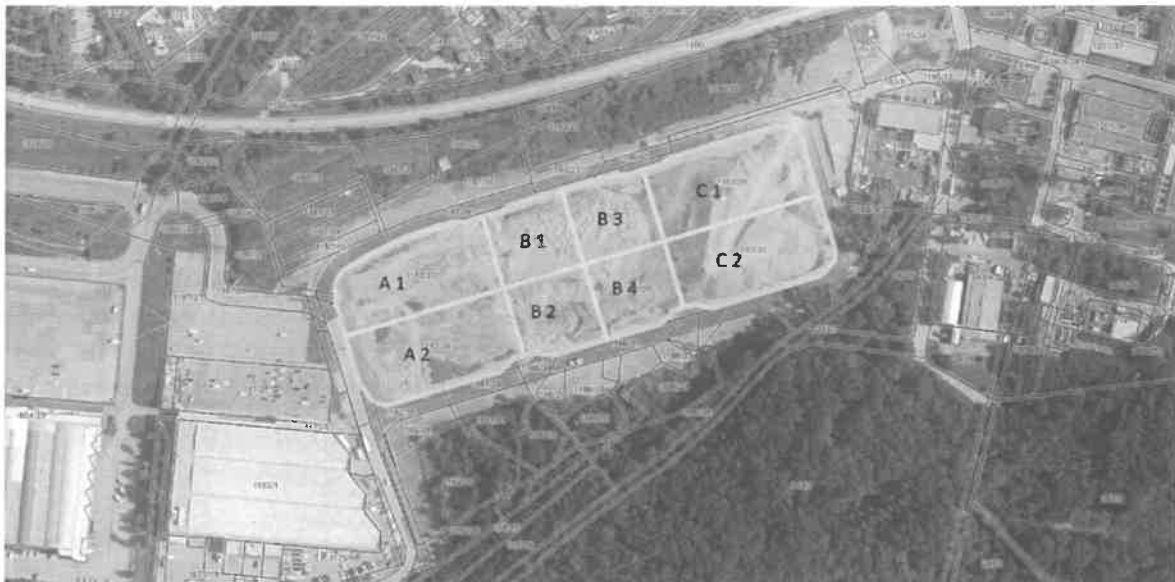
Slika 1: Prikaz Poslovno ekonomske cone Kromberk

Predmet javnega zbiranja ponudb je prodaja v nadaljevanju navedenih stavbnih zemljišč, ki so namenjena za gospodarske dejavnosti mikro, malih in srednje velikih podjetij (v nadaljevanju: MSP), in sicer: