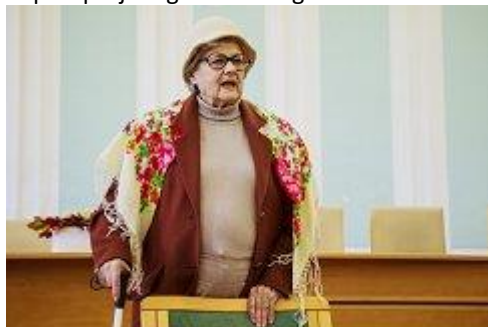
Nastop članice MDSS Nova Gorica