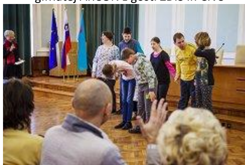
Nastop zbora invalidov