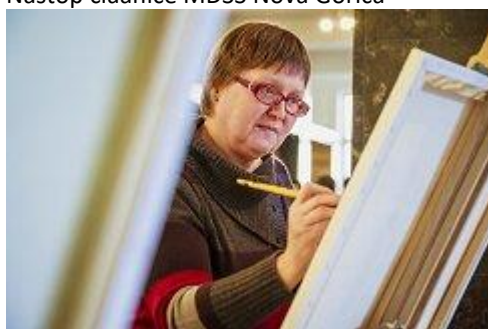
Invalidnost ni ovira za ustvarjalnost