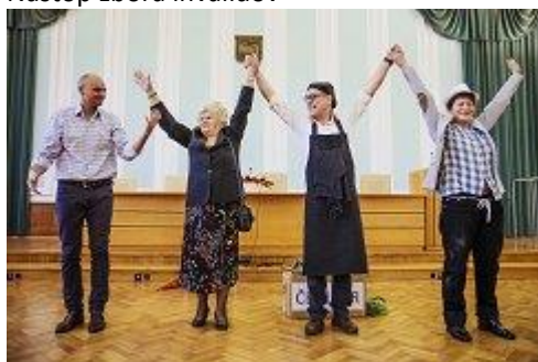
Topel sprejem gledaliških igralcev