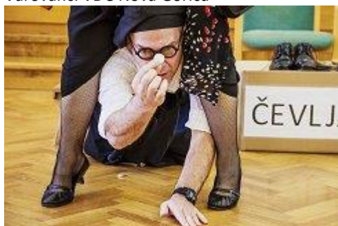
Gledališka skupina DGN Severne Primorske