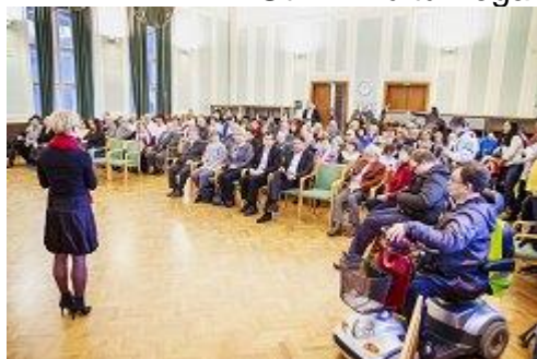
Udeležba na prireditvi je bila nad pričakovanji

Utrinki kulturnega programa ob Mednarodnem dnevu invalidov