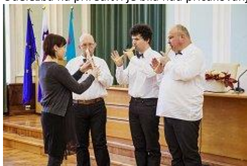
Varovanci VDC Nova Gorica