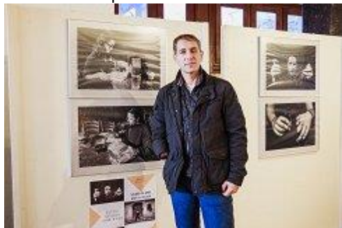
Član civilnih invalidov vojn razstavlja