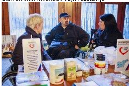
Paraplegiki se predstavljajo