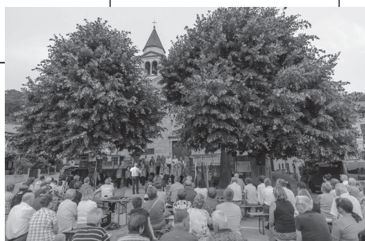
Letos junija se pevci vračajo na oba solkanska trga.