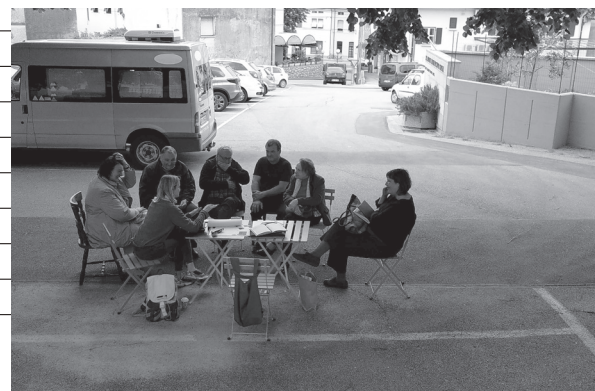
Letos se bo začelo dogajati na Trgu M. Plenčiča