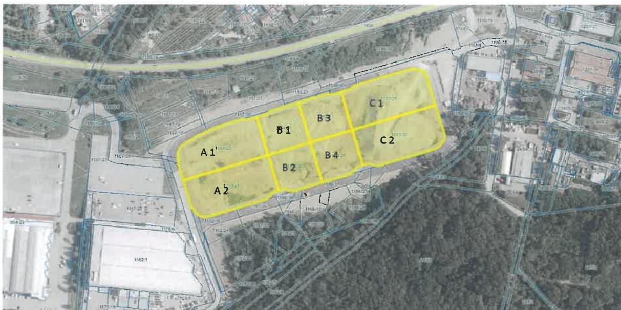
Slika 1: Prikaz Poslovno ekonomske cone Kromberk

Predmet javnega zbiranja ponudb je prodaja v nadaljevanju navedenih stavbnih zemljišč, ki so namenjena za gospodarske dejavnosti mikro, malih in srednje velikih podjetij (v nadaljevanju: MSP), in sicer: