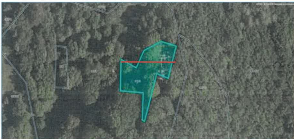
Slika 2.1: Lokacija parcele

Lokacija parcele je prikazana na sliki 2.1