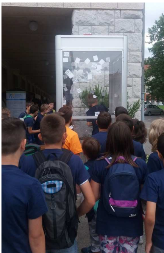
Slika / Bild 8

V sklopu projekta NEKTEO je bila izdelana tudi CO 2 kabina, pri kateri so se na Dnevu OVE in URE najbolj pogumni javili, da v omejenem času ulovijo največ CO 2 lističev in s tem prispevajo k varovanju okolja.