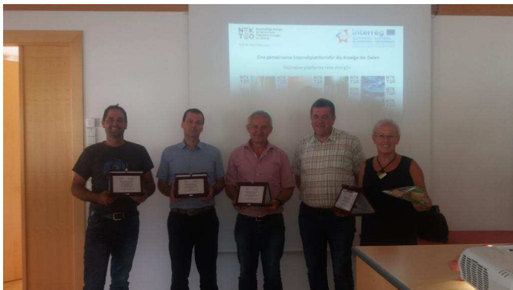
Slika / Bild 3

V okviru čezmejne strokovne ekskurzije smo izvedli tudi RAZGLASITEV REZULTATOV NEKTEO čezmejnega NATEČAJA – razglasitev energetske najbolj učinkovite: