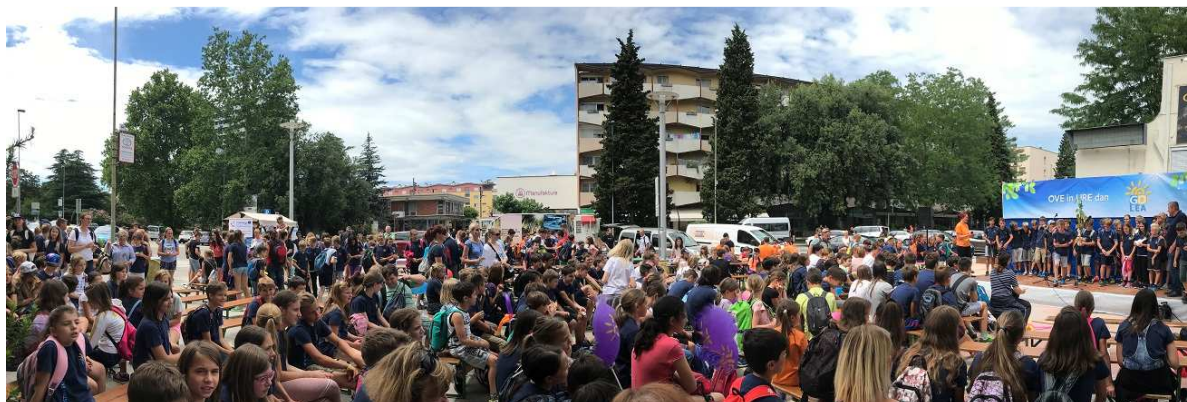
Slika / Bild 6

DOGODKI, SREČANJA, JAVNE PREDSTAVITVE, SEJMI, KONFERENCE VERANSTALTUNGEN, SITZUNGEN, ÖFFENTLICHE VORSTELLUNGEN, MESSEN, KONFERENZEN