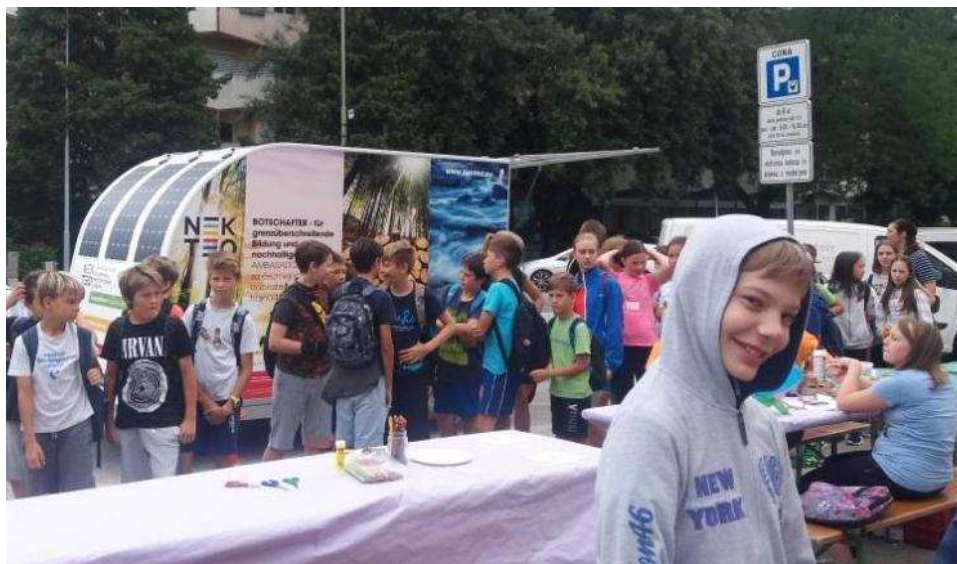
Slika / Bild 10