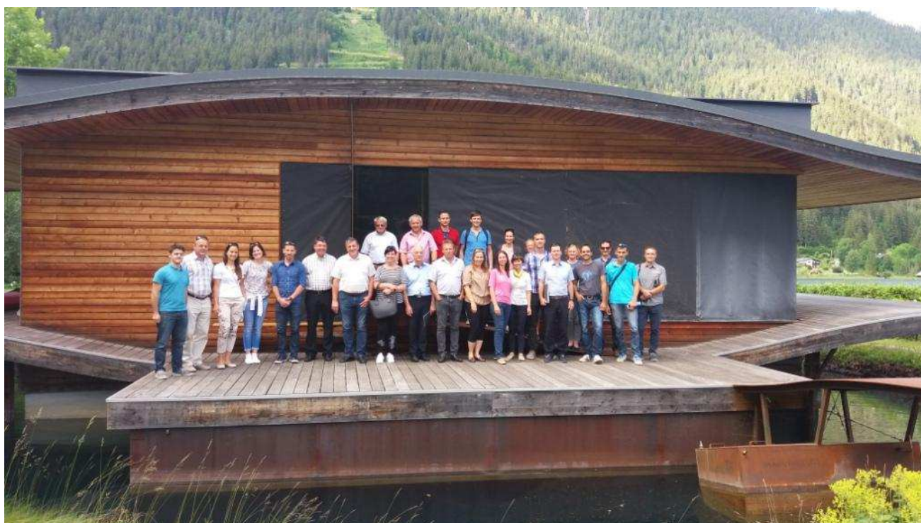
Slika / Bild 1: Ogljed konceptualno-znanstvene plavajoče hiše ob Belem jezeru na A. Koroškem, NEKTEO čezmejna strokovna ekskurzija, Weissensee / Belo Jezero, junij 2018 /

Besuchen Sie uns im September 2018 auf kommenden Veranstaltungen, um weitere Informationen über NEKTEO Schulungen, Fachexkursionen und andere interessante Veranstaltungen zu erhalten!