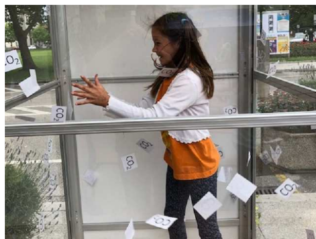
Slika / Bild 9

Im Rahmen des Projekts NEKTEO wurde auch eine CO 2 -Kabine gebaut. Während des EEG und EEN Tages meldeten sich die Mutigsten und versuchten in einer begrenzten Zeit die meisten CO 2 Scheine zu fangen und somit zum Schutz der Umwelt beizutragen.