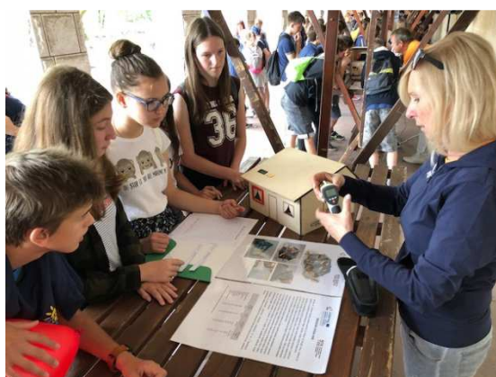
Slika / Bild 7