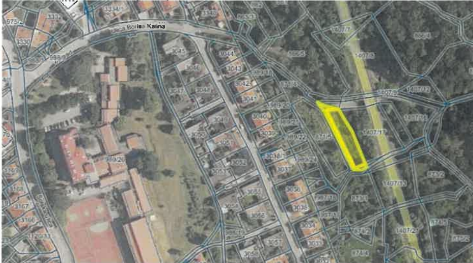
Slika 3: Prikaz parcel za prodajo

Opozorilo: Zemljišči se prodajata po načelu »videno-kupljeno«.