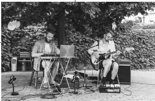
GLOG sta trg obiskala junija.