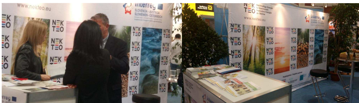
Slika / Bild 9: Predstavitev NEKTEO projekta na sejmu Häuslbauermesse februarja 2019 v Celovcu / Vorstellung des NEKTEO-Projekts auf der Häuslbauermesse im Februar 2019 in Klagenfurt / (Avtor / Autor: Iris Speiser, Amt der Kärnten Landesregierung, Abt. 8)

DOGODKI, SREČANJA, JAVNE PREDSTAVITVE, SEJMI, KONFERENCE VERANSTALTUNGEN, SITZUNGEN, ÖFFENTLICHE VORSTELLUNGEN, MESSEN, KONFERENZEN