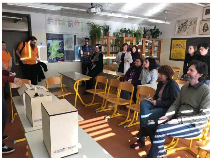
Slika / Bild 5

Der NEKTEO Botschafter mit seinen interessanten didaktischen Hilfsmitteln über Energieeffizienz und erneuerbare Energiequellen reist zu Pilotgemeinden und Schulen im Projektgebiet der Regionen Goriška und Gorenjska und nach Kärnten.