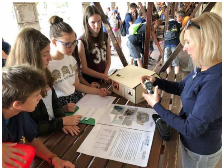
Slika / Bild 12