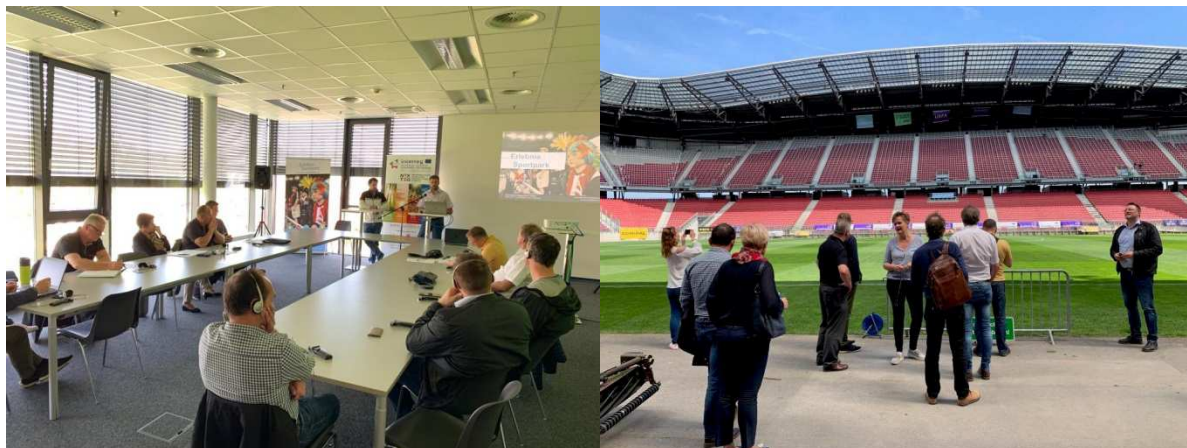
Slika / Bild 3 in / und 4, Avtor / Autor: Ivana Kacafura, GOLEA