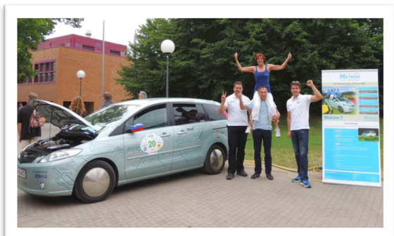
Slika / Bild 10: 826 km dometa s prototipom e-avta / 826 km Reichweite mit E-Auto Eigenbau