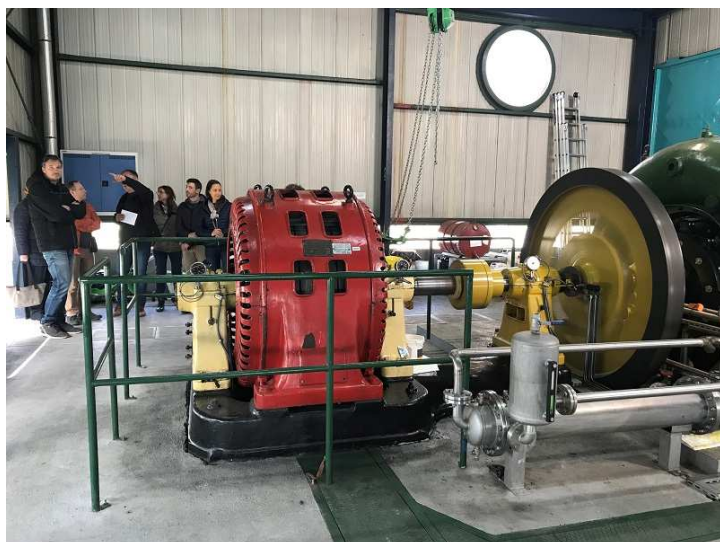
Slika / Bild 2: Ogled Energetske vzorčne točke Mala hidroelektrarna Idrija, 8. Partnerski sestanek NEKTEO projekta, marec 2019 / Besichtigung des Energieschauplatzes Kleinwasserkraftwerk Idrija, 8. NEKTEO-Projektpartnertreffen, März 2019