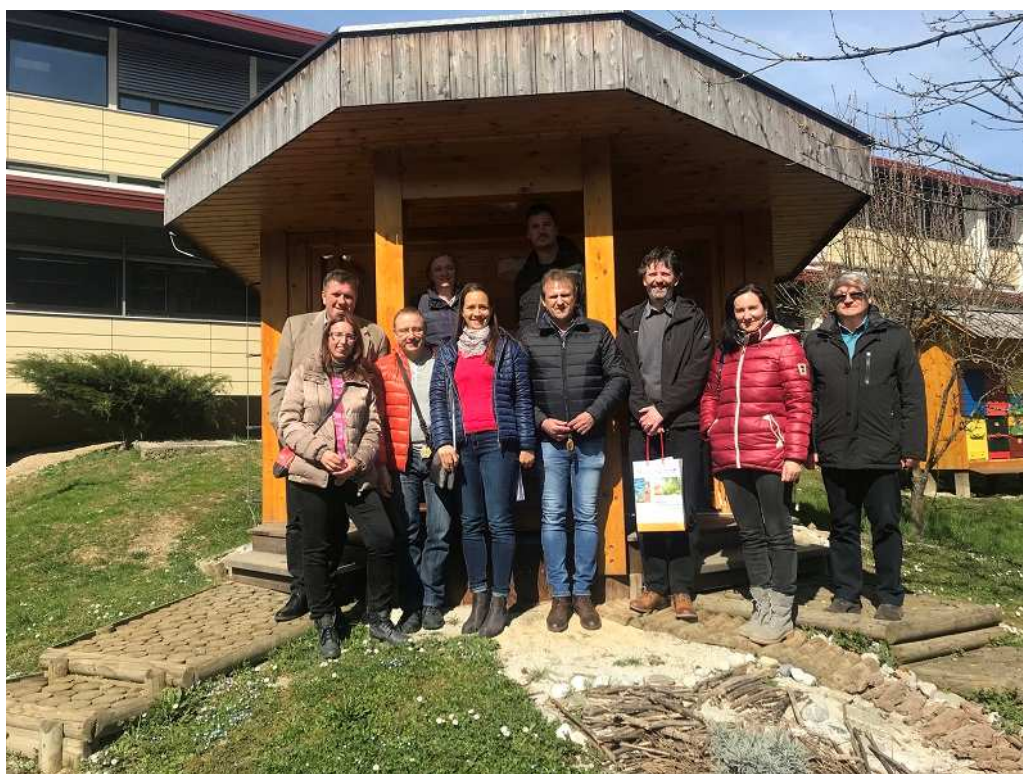
Slika / Bild 1: Oglad Energetske vzorčne točke Osnovne šole Cerčno s Brunarico obnovljivih virov energije, 8. Partnerski sestanek NEKTEO projekta, marec 2019/

Besuchen Sie uns 2019 auf Veranstaltungen , um weitere Informationen über NEKTEO Schulungen, Fachexkursionen und andere interessante Veranstaltungen zu erhalten!