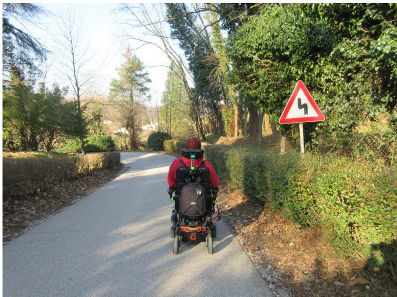
Slika 1: Ozka cesta

V samem začetku je cesta je ozka, zelo prometna, nekateri vozniki motornih vozil vozijo prehitro.