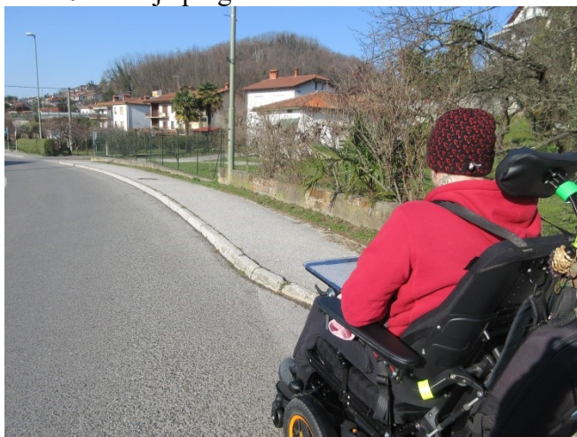
Slika 9: vožnja po glavni cesti

Pot nadaljujemo po cesti, ker naslednji pločnik nima klančine.