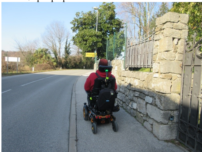
Slika 15: pot po pločniku do kolesarske steze

Sporočite nam, če potrebujete še dodatne informacije. V upanju, da bomo lahko našli skupno rešitev in težave odpravili, vas lepo pozdravljamo,