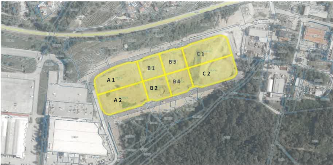
Slika 1: Prikaz Poslovno ekonomske cone Kromberk

Predmet javnega zbiranja ponudb je prodaja v nadaljevanju navedenih stavbnih zemljišč, ki so namenjena za gospodarske dejavnosti mikro, malih in srednje velikih podjetij (v nadaljevanju: MSP), z izjemo zemljišč z oznako A1 in A2, za katera lahko ponudbo oddajo tudi velika podjetja in sicer: